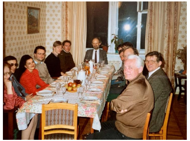
Soviet-West German Seminar, 1990