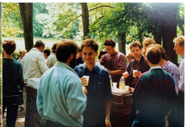
Ausflug mit Radtour durch den Göttinger Wald, 1989