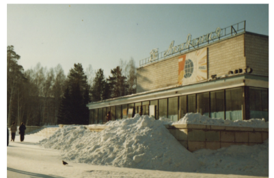
Akademgorod, Kulturzentrum, 1990