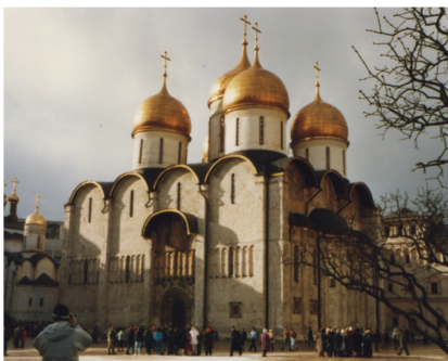
Moskau, Kreml, 1990