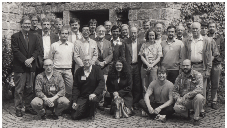
Ringberg, ca. 1993